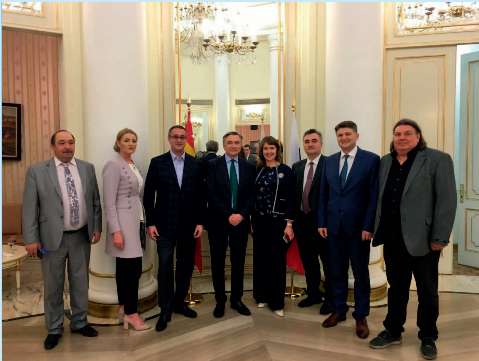
Состав российской делегации на презентации Казани в Испании